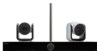
EagleEye Director II カメラ