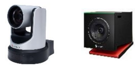
EagleEye USB カメラ