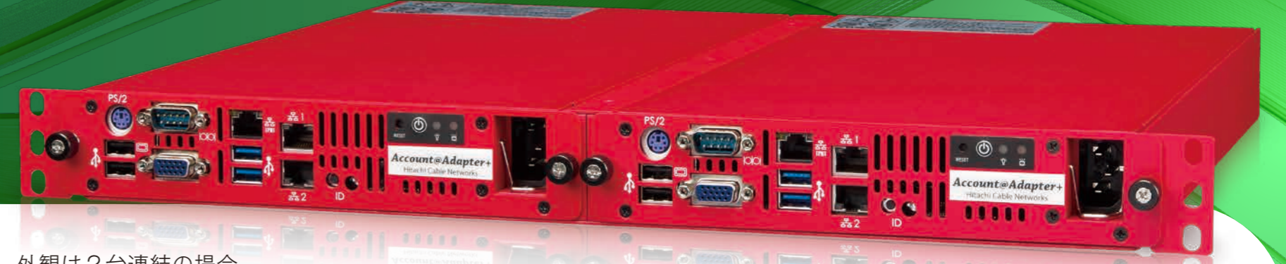
外観は2台連結の場合