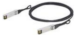
Active Optical Cable(5m)

スタートアップキットには設置、設定費用は含まれません。APRESIA用SDカードは512MBモデルとなります。APRESIAは1年間のセンドバック保守を含みます。スタートアップキットに含まれるAPRESIAにオプションライセンスは含まれません。本キャンペーン価格は、キャンペーン期間内に、エイチ・シー・ネットワークス株式会社に、直接お申し込みいただいた場合のみ適用いたします。